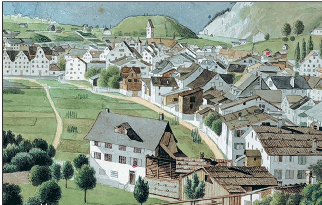
Il y a 225 ans, les autorités et l'Eglise de Glaris avaient eu un comportement peu reluisant avec leur «sorcière» Anna.

JUSTICE • Un mélange de mysticisme, de suspense, de sexe et de crime. C'est tout cela qui explique l'émoi et la polémique en Suisse alémanique autour de la «sorcière» Anna Göldi. La bougresse a été décapitée il y a 225 ans à Glaris. Amante de son patron, elle avait